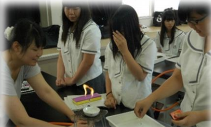
パーミキュライトの加熱実験。熱を加えると鉱物が変形していきます。