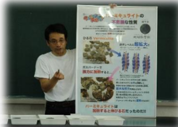
パーミキュライトの説明